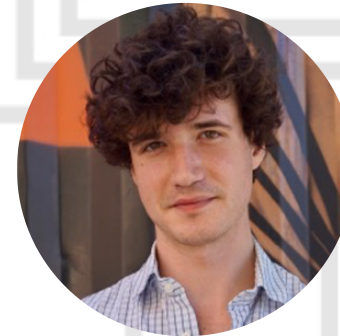
Inhalt & Format Ozan