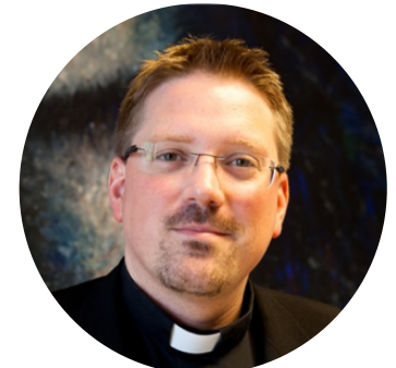
Finanzen & Recht Tobi