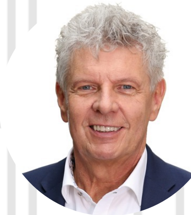
Dieter Reiter Oberbürgermeister

Wir sind überzeugt von München2040, deswegen setzt sich das Team dieser Non-Profit-Veranstaltung hauptsächlich aus Ehrenamtlichen zusammen.